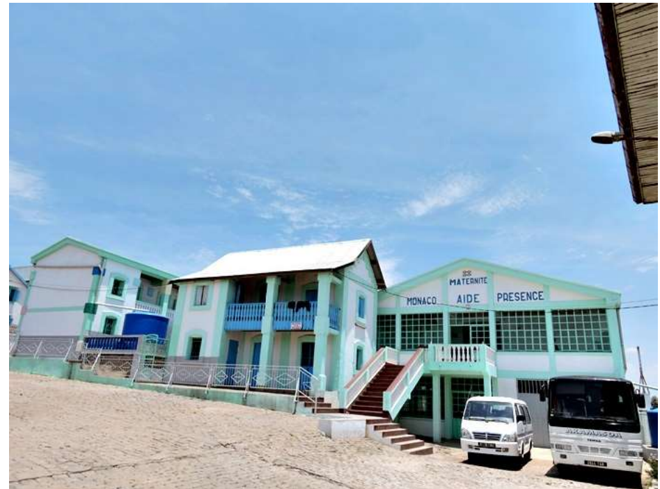
La maternité de Manantenasoa