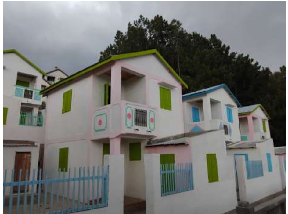
Village de Manantenaso