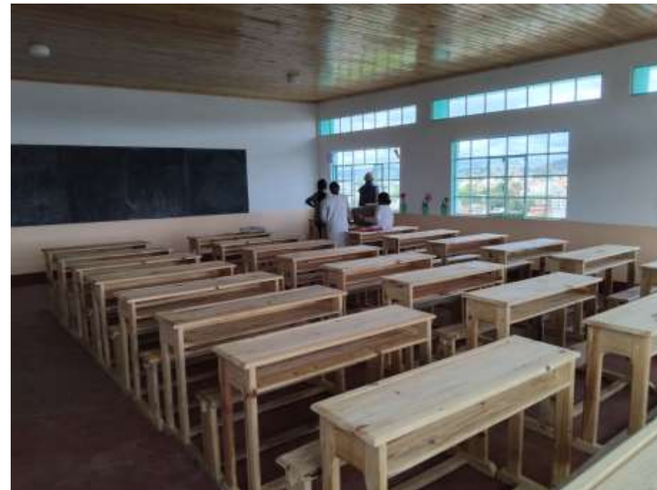
Nouvelle école primaire à Andralanitra