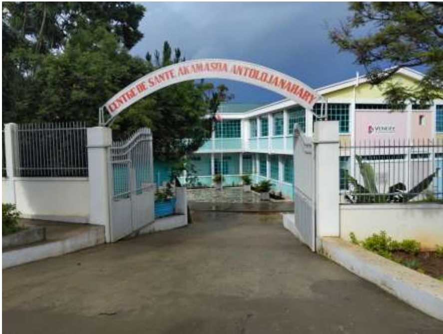
La maternité d'Antolojanahary